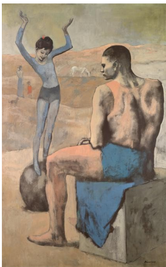
ПАБЛО ПІКАССО. «Дівчинка на кулі»