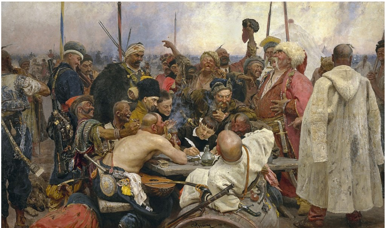
ІЛЛЯ РЕПІН. «Запорожці»