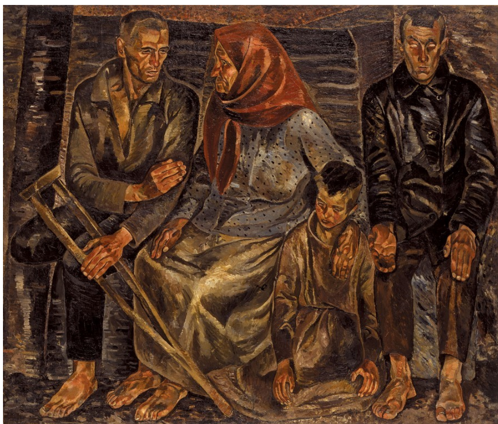
АНАТОЛЬ ПЕТРИЦЬКИЙ. «Інваліди»