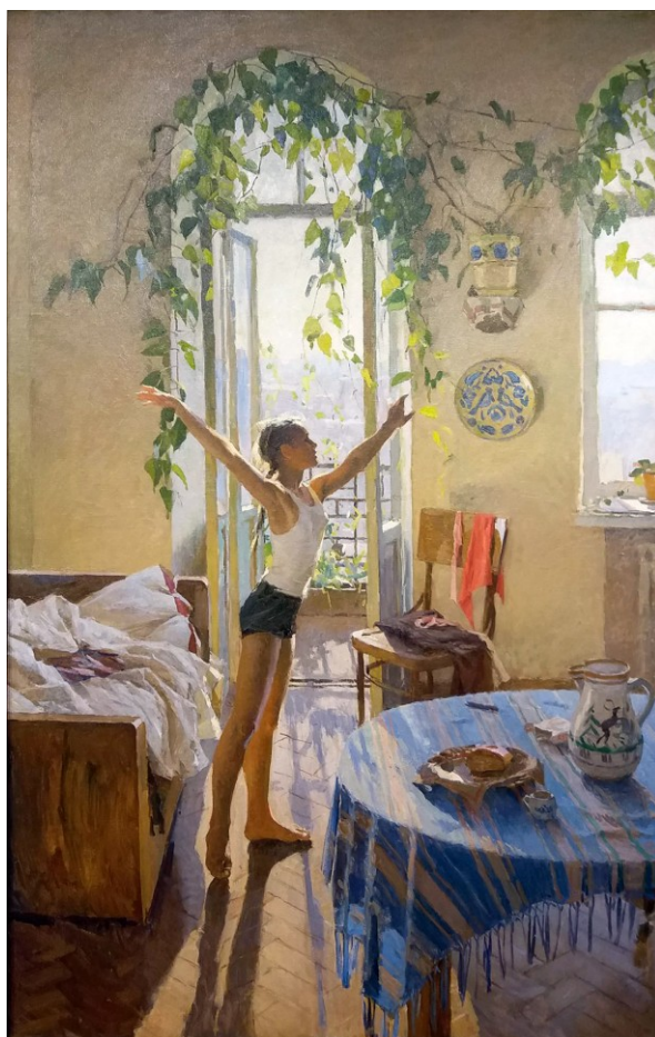
ТЕТЯНА ЯБЛОНСЬКА. «Ранок»