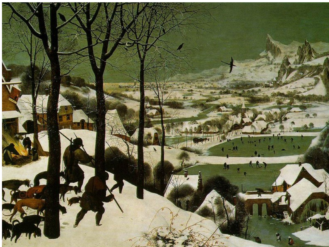
ПІТЕР БРЕЙГЕЛЬ СТАРШИЙ. «Мисливці на снігу»