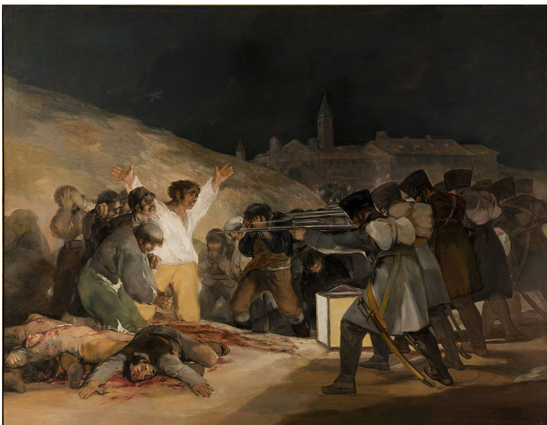
ФРАНСІСКО ГОЙЯ. «Розстріл 3 травня 1808 року»