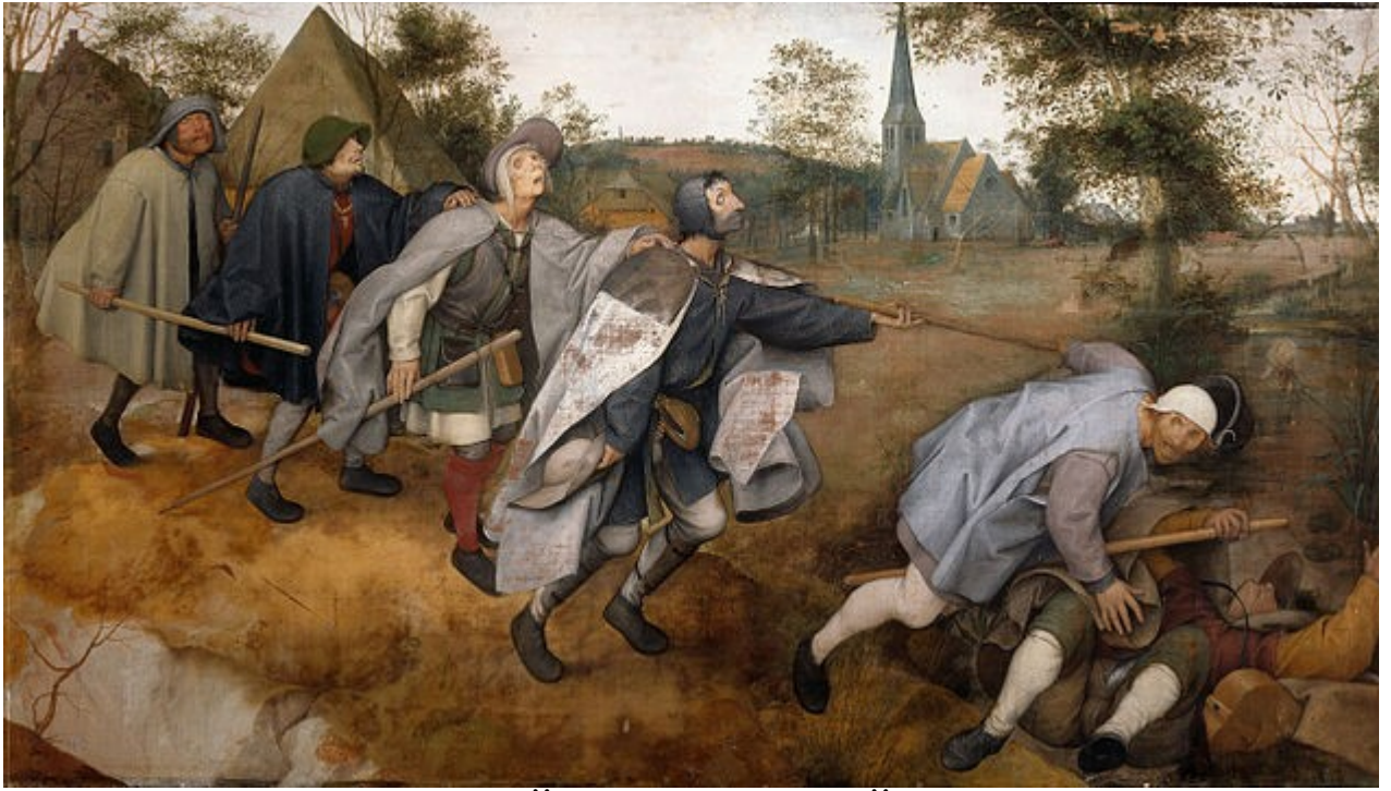
ПІТЕР БРЕЙГЕЛЬ СТАРШИЙ. «Сліпі»