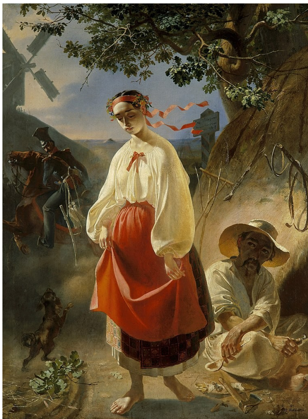
ТАРАС ШЕВЧЕНКО. «Катерина»