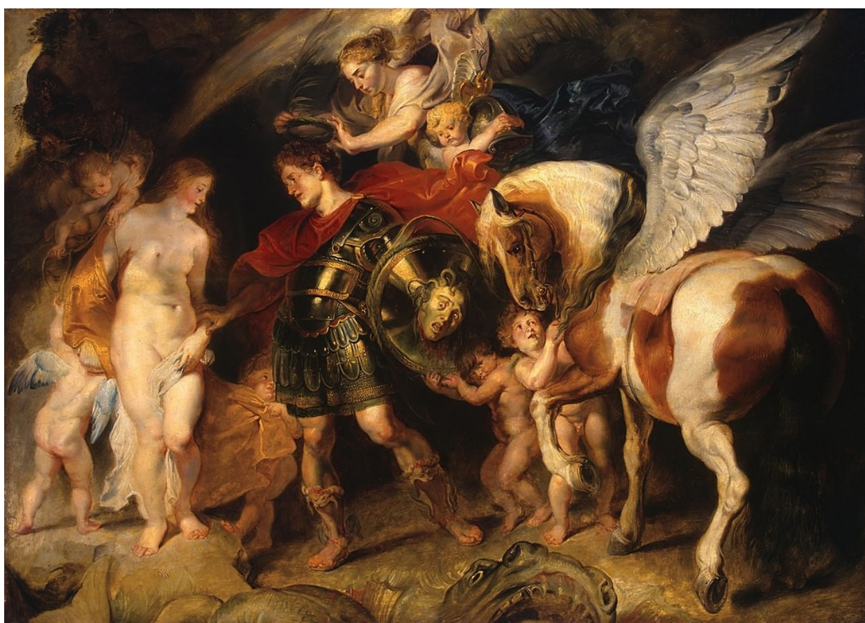
ПІТЕР-ПАУЛЬ РУБЕНС. «Персей і Андромеда»