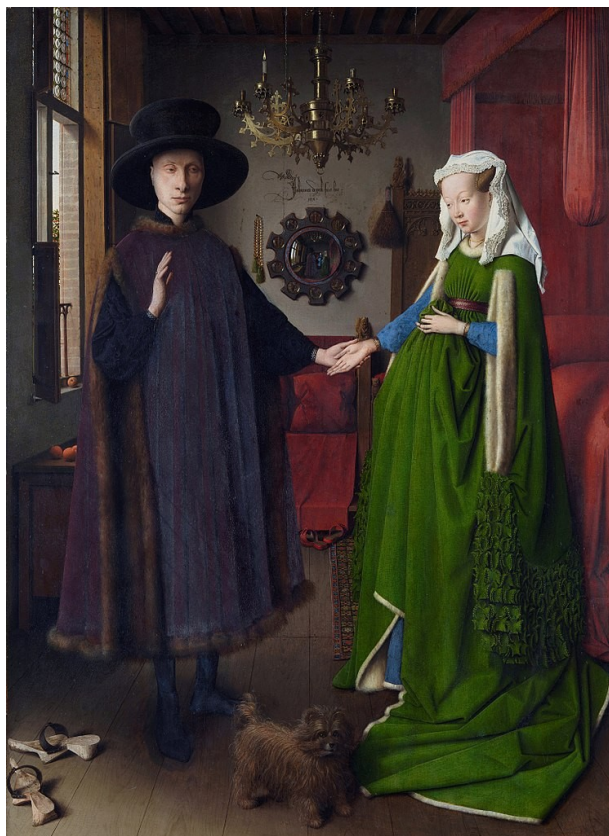
ЯН ВАН ЕЙК. «Портрет родини Арнольфіні»