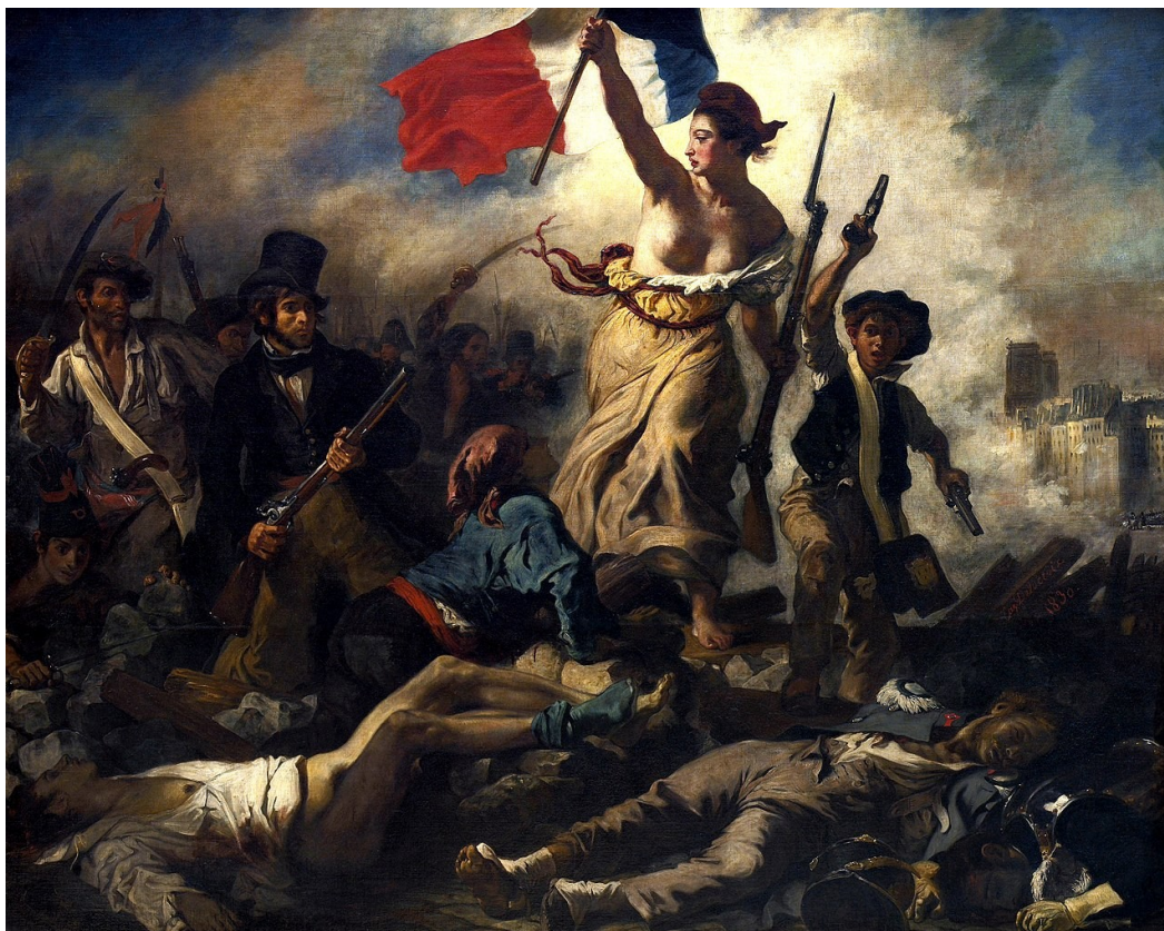
ЕЖЕН ДЕЛАКРУА. «Свобода на барикадах»