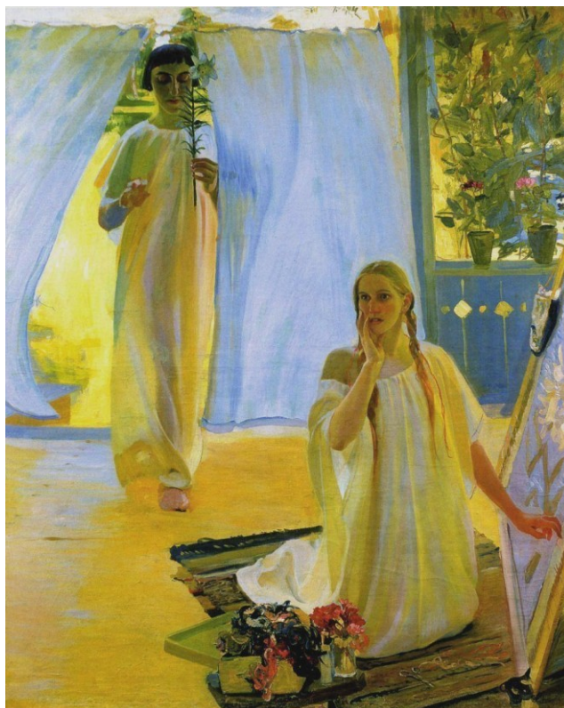
ОЛЕКСАНДР МУРАШКО. «Благовіщення»