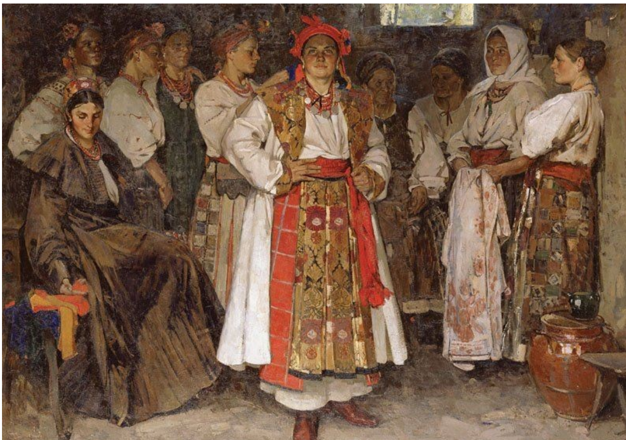
ФЕДІР КРИЧЕВСЬКИЙ. «Наречена»