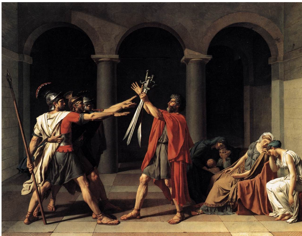
ЖАК-ЛУЇ ДАВИД. «Клятва Гораціїв»