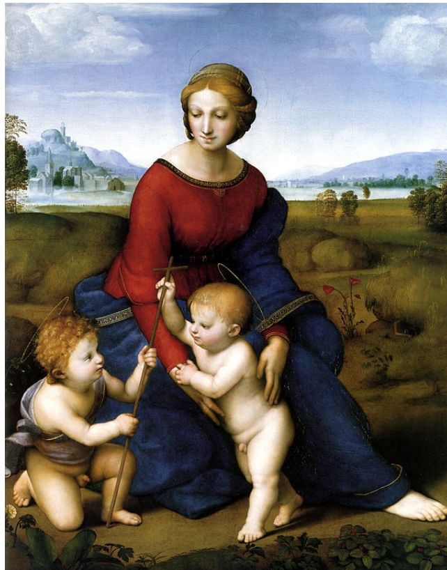
РАФАЕЛЬ САНТІ. «Мадонна в зелені»