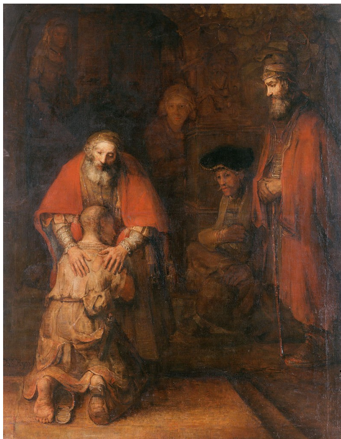
РЕМБРАНДТ. «Повернення блудного сина»