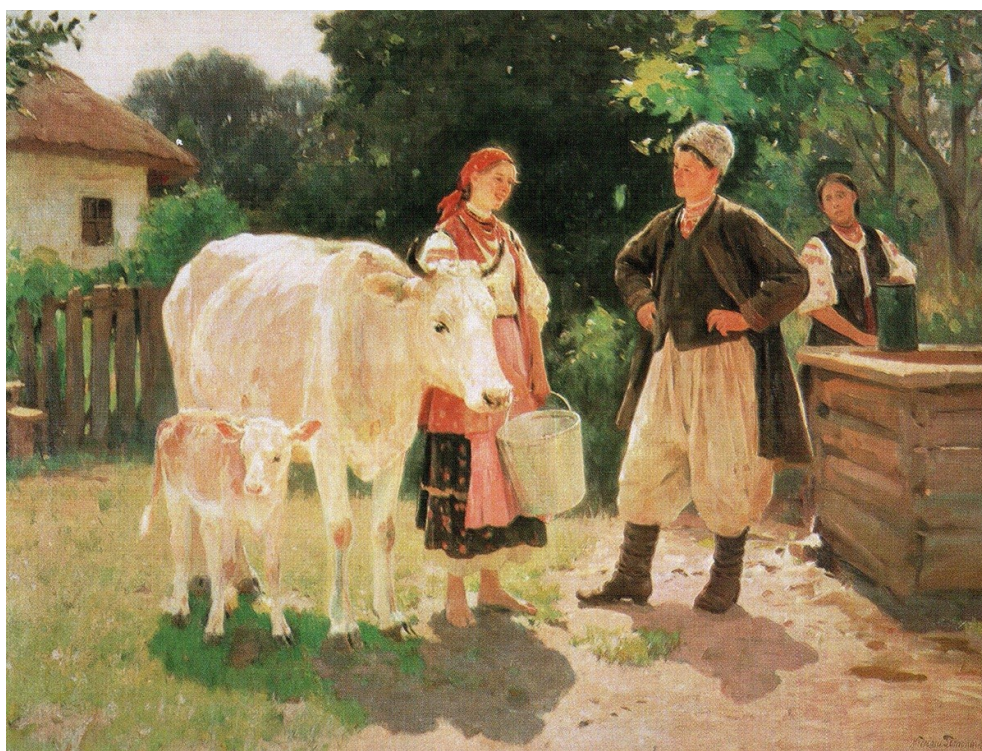
МИКОЛА ПИМОНЕНКО. «Суперниці. Біля криниці»