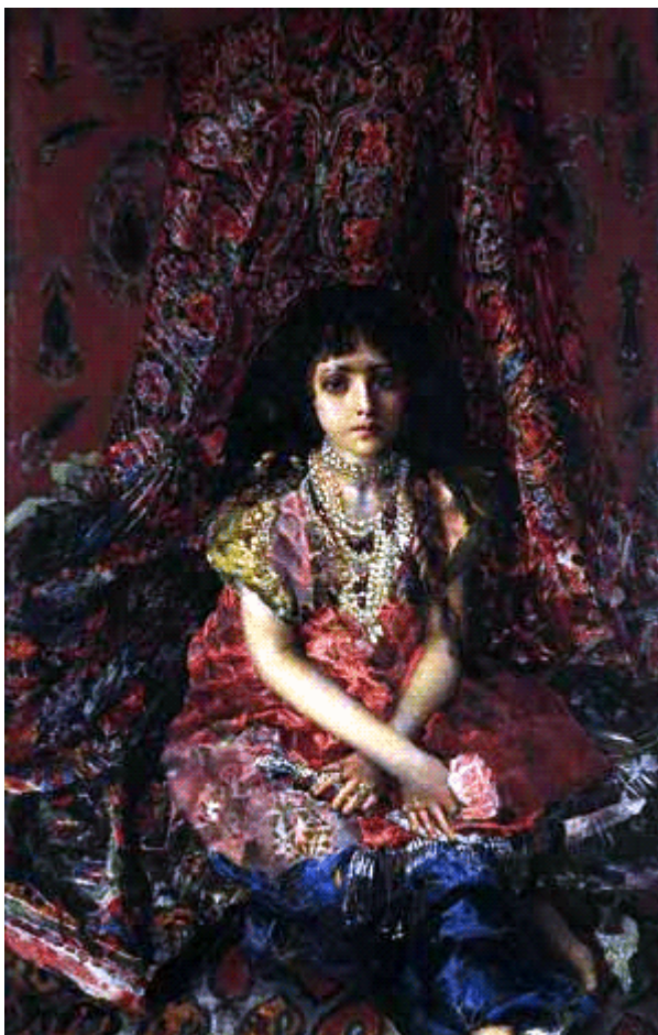
МИХАЙЛО ВРУБЕЛЬ. «Дівчинка на тлі персидського килима»