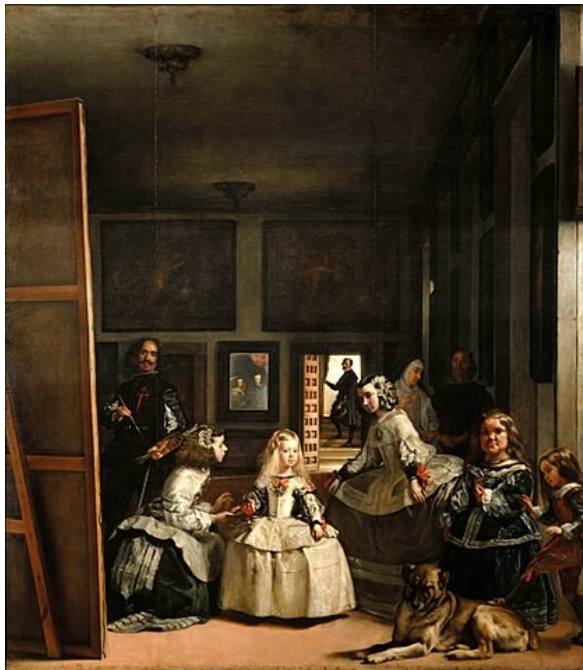
ДІЄГО ВЕЛАСКЕС. «Меніни»