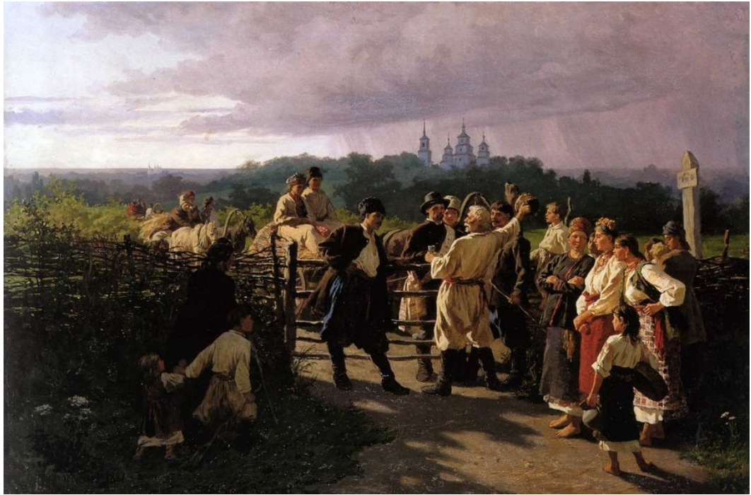
КОСТЯНТИН ТРУТОВСЬКИЙ. «Весільний викуп»