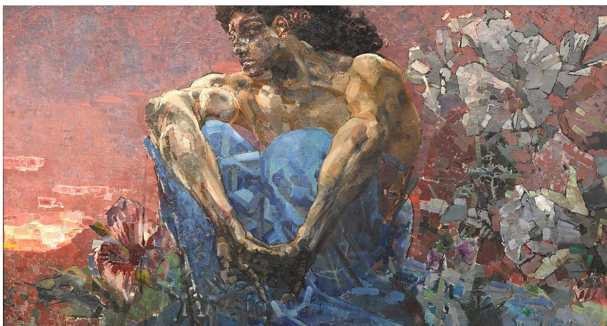
МИХАЙЛО ВРУБЕЛЬ. «Демон, що сидить»